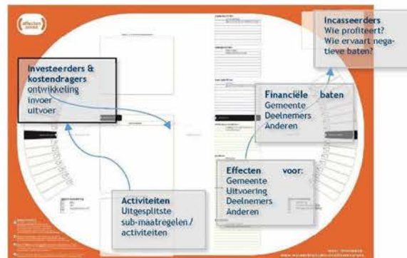
Figuur 1. Werkblad EffectenArena

In een gesprek van ongeveer 2,5 uur gaan de deelnemers met elkaar in gesprek over de investeringen die gedaan worden, de acties/activiteiten die ondernomen worden, de resultaten (output), effecten (outcome) en de uiteindelijke incasseerders. Centraal in het gesprek staat de verbinding tussen deze onderdelen (zie figuur 1)